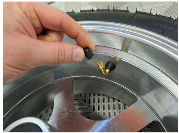
Ota venttiilin hattu pois.