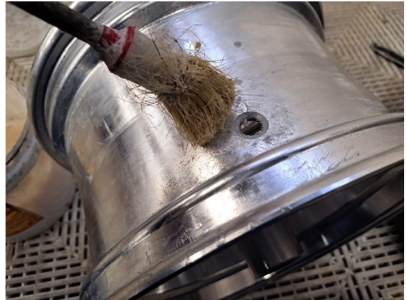
Levitä vanteen venttiilin reikään rengasrasvaa.