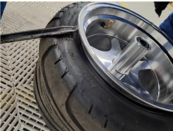
Paina renkaan reunat irti vanteesta molemmilta puolilta. (rengasrauta).