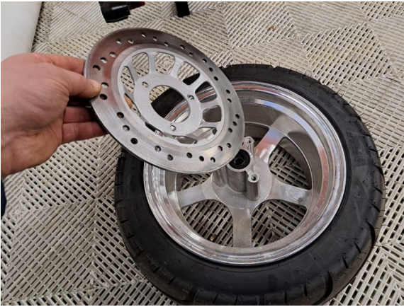
Ota jarrulevy pois.