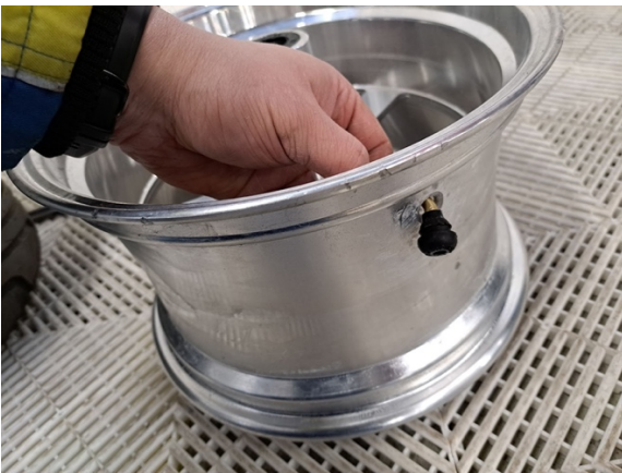
Laita uusi venttiili vanteeseen.