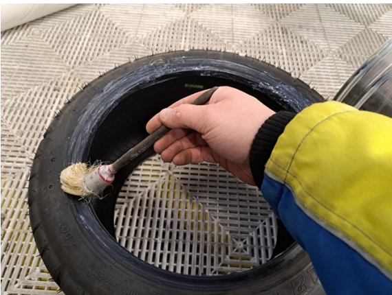
Levitä rengasrasvaa renkaan kumpaankin reunaan.