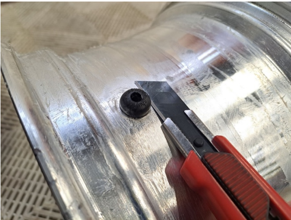
Leikkaa vanha venttiilin kanta pois ja ota venttiili pois. (mattoveitsi).