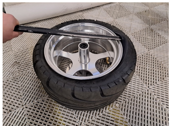
Aseta rengasrauta renkaan ja vanteen väliin ja nosta renkaan reunaa kuvan osoittamalla tavalla.