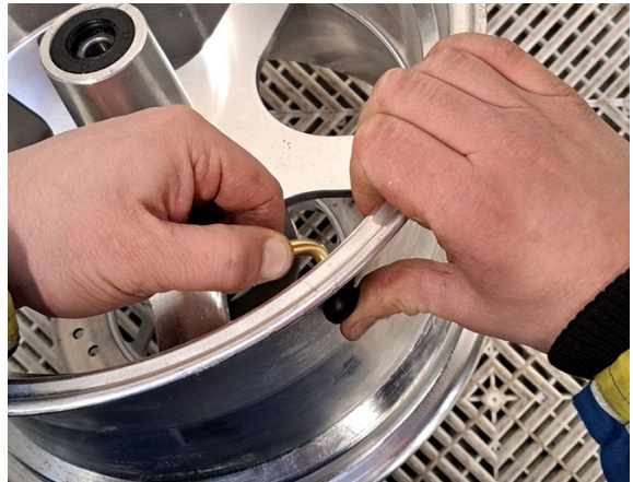
Paina venttiili paikoilleen.