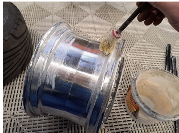
Levitä rengasrasvaa vanteeseen.