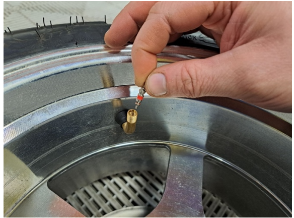
Ota venttiilin sielu pois.