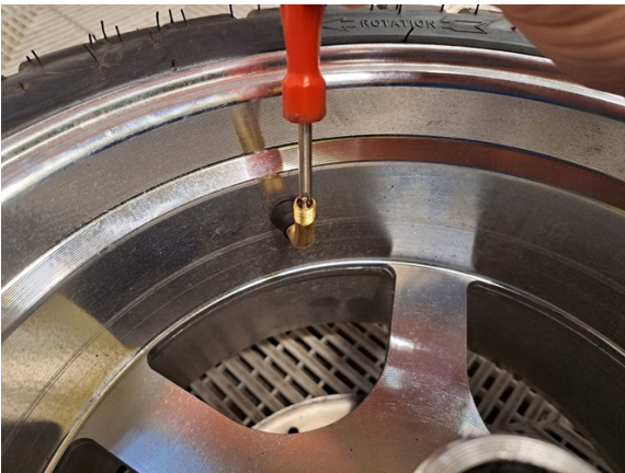
Avaa venttiilin sielu (venttiilityökalu) päästä ilmat pihalle.